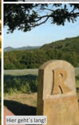
Hier geht's lang!

Eine Wanderreise auf dem Rennsteig ist ein „Muss“ für jeden Wanderfreund. Auf dem historischen Kammweg erleben Sie die überwältigende Naturschönheit der Thüringer Berge. Genusswanderer kommen bei dieser Reise voll auf ihre Kosten: Sie genießen unseren zuverlässigen Gepäcktransport und schlafen in ausgesuchten Hotels. Bei den durchschnittlich 15½ km langen Tagesetappen bleibt genug Zeit, die geschichtsträchtigen Sehenswürdigkeiten entlang des Rennsteigs mit Muße zu erkunden.